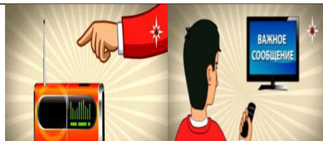
Включите радио, телевизор

Через уличные громкоговорители или другие средства оповещения будет передан звуковой сигнал оповещения. Непрерывное звучание сирены в течение трех минут или прерывистые гудки промышленных предприятий, организаций означают сигнал «Внимание всем!»